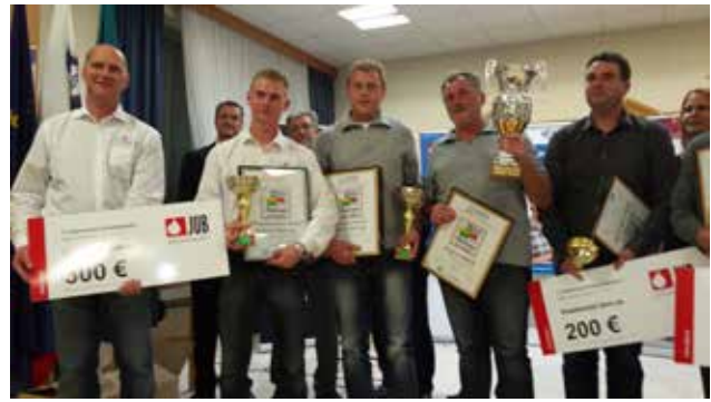
Prejemniki priznanj

Humanitarno akcijo že vseh 17 let podpira podjetje JUB, ki zagotovi vse potrebne barve in premaze ter nastopa v vlogi generalnega sponzorja akcije. Letos so za barvito prenovo 2.500 kvadratnih metrov stenskih površin zago-