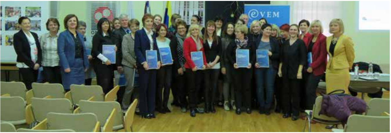
Predstavniki točk Vem Savinjske regije

naročnika. Zaposleni v podjetju imajo znanja z različnih področij in se tako dopolnjujejo, največji izziv pa vidijo v nenehnih spremembah in prilaganju, in kot je povedal g. Zafošnik: »Podjetnik se ne sme zaljubiti v svojo idejo, ampak mora biti ves čas odprt in na preži za novimi poslovnimi priložnostmi.