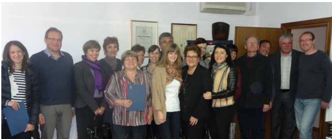
Udeleženci dogodka