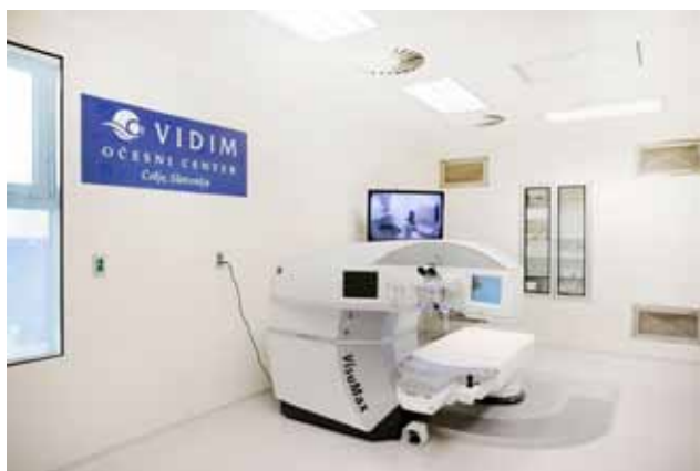
Vrhunski laserski aparat

Konec meseca maja so v očesnem centru VIDIM predstavili najnovejšo lasersko metodo ReLEx SMILE za odpravo dioptrije, ki so jo pričeli uporabljati prvi v Sloveniji in tudi v tem delu Evrope. Metoda se izvaja z vrhunskim laserskim aparatom VisuMax nemškega proizvajalca Carl Zeiss . Podjetje Vidim d.o.o. Celje je bilo ustanovljeno marca leta 2005 z namenom opravljanja koncesijske zdravstvene dejavnosti na področju okulistike ter samoplačniških okulističnih storitev. Podjetje je primarno usmerjeno na operativno okulistiko. V Vidim, očesnem kirurškem centru Celje, Mariborska cesta 88, opravijo povprečno 700 ambulantnih pregledov in 100 operacij na mesec.