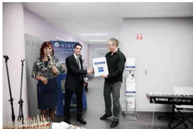
Dr. Drev in predstavnik podjetja C. Zeiss

Vidim, očesni kirurški center, je referenčni partner podjetja ZEISS v tem delu Evrope na področju operativne okulistike. Je tudi v postopku pridobivanja mednarodne akreditacije za zdravstvene dejavnosti po sistemu AACI (nadgradnja standarda ISO 9001).