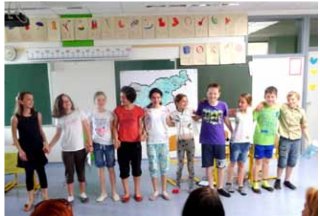
Podjetniški krožek OŠ Lava SKUPI SMO UPI

Do zaključka šolskega leta bodo znanje, osvojeno v podjetniških krožkih ter svoje lastne izdelke, večinoma v povezavi z mestom Celje, predstavili še udeleženci krožkov na OŠ Ljubečna, ki so si naredili ime Kreativčki ter krožkov na I. OŠ in IV. OŠ Celje . Delo v krožkih in izdelki učencev bodo predstavljeni septembra na razstavnem prostoru OZS na Ulici obrti v okviru Mednarodnega obrtnega sejma v Celju. Vsi udeleženci krožkov se bodo skupaj z mentorji zbrali 17.6.2015 na zaključku v Muzeju novejšje zgodovine v Celju, kjer jim bodo mojstri obrti iz Muzejske obrtne ulice predstavili, kako so obrtniki svoje delo opravljali pred mnogimi leti.