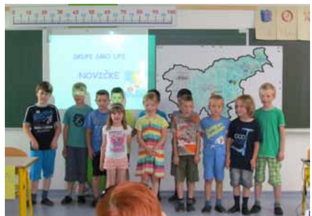
Podjetniški krožek OŠ Lava BELI TIGRI