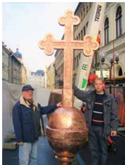
obnova zvonika in Marijine cerkve v Celju