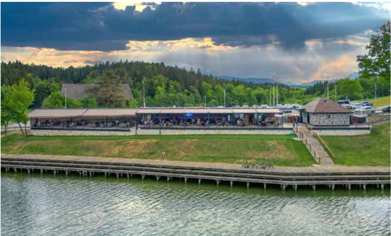
Panorama: Kavarna Panorama je sestavljena iz ogromno majhnih in večjih detajlov, ki gostom zagotavljajo udobje in ohranijo občutek bližine narave.

Ker je Vuzem navdušen športnik in opaža, da se ljudje ob jezeru veliko rekreirajo, si želi, po vzoru iz tujine, gostinski ponudbi dodati moderen